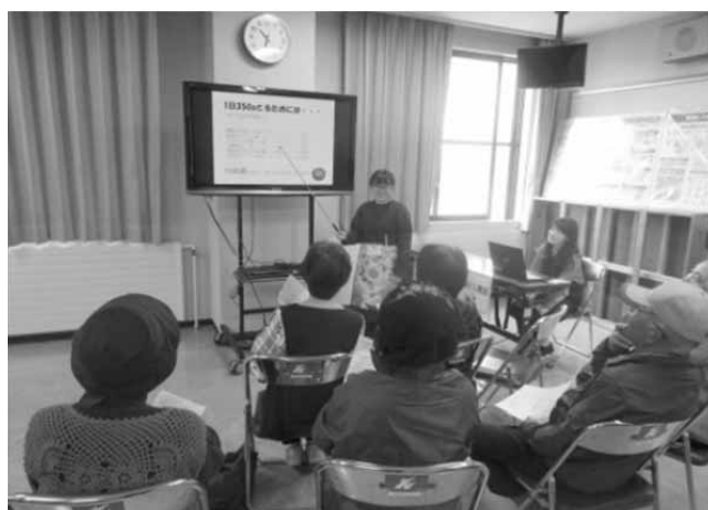
写真3 健康ミニ講話