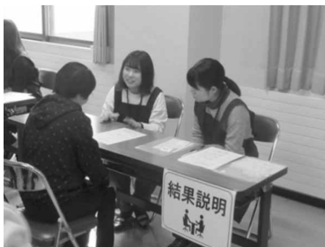
写真2 体組成結果説明