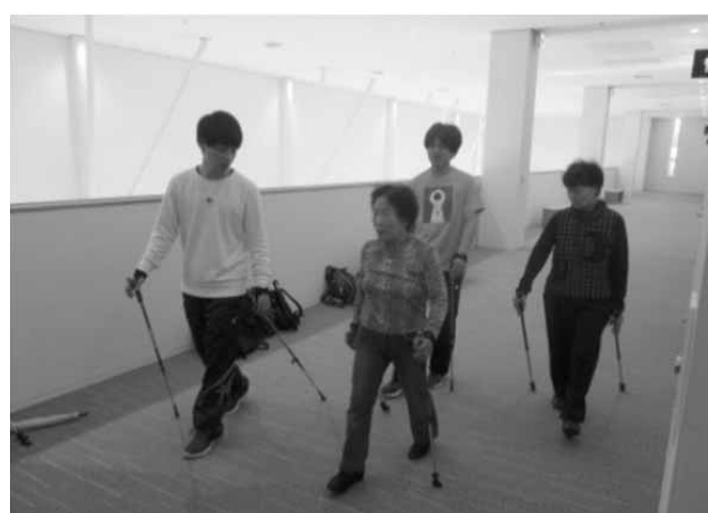
写真4 ノルディックウォーキング体験