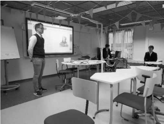
写真3 カヤーニ応用科学大学講義室

トップアスリートとして成功できる者はごく僅かであるため、その後のライフプランとして、スポーツに関連した理学療法士等の資格を取り就職できることは重要である。