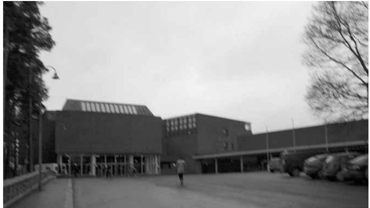
写真4 建築家アールト設計のユバスキュラ大学