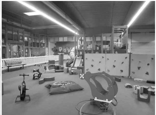
写真6 SuperPark Vuokatti (スーパーパーク ヴォカティ) 内の遊具

冬期間雪に覆われ、特に暗い時間帯が長くなるフィンランドで、子どものインドア志向は社会的な問題になっている。幼少時より運動をしないことによる肥満の増加がその問題の一つである。今回視察を行った VuokattiHalli (ヴォカティホール) (写真5) のような室内トレーニング施設(球技、プールなど)や SuperPark Vuokatti (スーパーパーク ヴォカティ) (写真6) のような子どもが楽しみながら身体を動かせる施設があることは、将来的にフィンランド国民全体の健康増進や疾病予防のために重要になると思われる。北海道でも同様に、肥満傾向児の出現率が全国平均よりも高い傾向 19) がみられ、冬期間の運動機会減少が一つの要因として考えられる。またスポーツ庁の調査によると、20歳から59歳までの世代は、週1日以上スポーツ実施率が全国平均よりも低く、運動不足を「感じる」とする割合が高かった 20) 。この世代を含めた全体の生活習慣病予防の観点から、運動する機会を増やすことは、健康寿命の延長につながると思われる。冬季スポーツ施設を持つ名寄市の場合、特にクロスカントリースキーが、冬期間取り組みやすい生涯スポーツ種目であると考えられる。生活の一部として冬季スポーツを定着させるためには、幼少時から市民や地域全体へ根付かせていくことが非常に重要である。