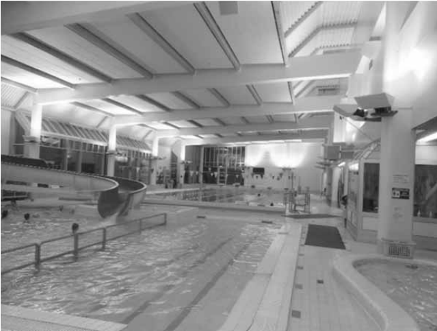
写真5 VuokattiHalli (ヴォカティホール) 内のプール