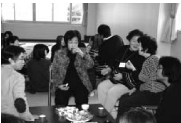
お茶を飲みながらの談笑

年配の方は、お茶を飲みながら、テーブルを囲んで会話に花が咲く。子どもたちと直接交わっていない方も、遠くから遊ぶ様子を見つめながら微笑んでいる姿が印象的であった。子どもたちが場所に慣れ、元気に遊び始めた頃、年配の方に「賑やか過ぎて、うるさくないですか」と尋ねると、「家にいると静かだし、見ているだけでもいいもんだね」と心地よさを感じているようであった。なかには積極的に親子の輪に入り声をかけている方もいた。「どんな遊びが流行っているのかな」「知っている手遊びとかはある？おばさんに教えてよ」と子どもに声をかけながら交流を図っている。