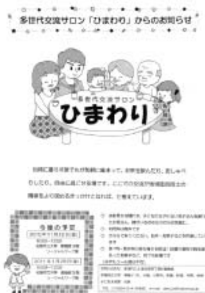
図1. 多世代交流サロン「ひまわり」の案内