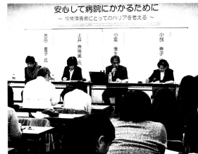
8日に札幌市内で開催された、視覚障害者の病院受診の課題を考えるシンポジウム