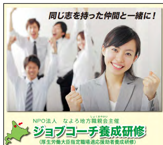
図1 ジョブコーチ養成研修の案内

北海道障害者職業センター旭川支所とは、以前より、協力関係にあり、名寄市立大学を会場にして、毎年、NPO法人なよろ地方職親会 1 が主催している研修会「ジョブコーチ養成研修 2 」など、様々な取り組みを連携して行なっている状況ではあるが、実際に、国のジョブコーチ支援事業を活用する際には、距離的な問題が出てくるのも事実である。