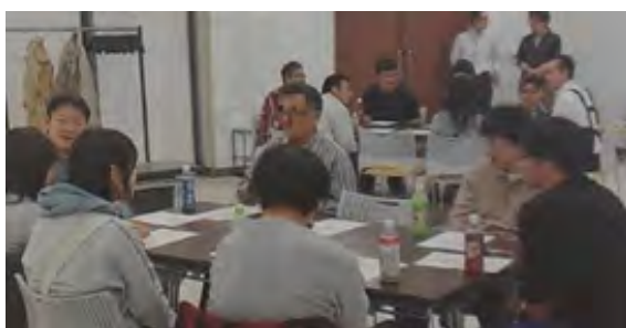
写真2 ジョブカフェの様子