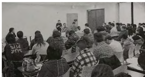
写真1 しごと講座の様子

の方を対象にした研修会「しごと講座 3 」や、就職をした障がい者の方のアフターフォローを行なうための茶話会「ジョブ・カフェ 4 」などがある。