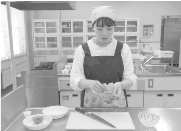
写真3「簡単に作れる調理方法について説明」