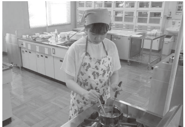
写真4「簡単に作れる料理の実際について説明」