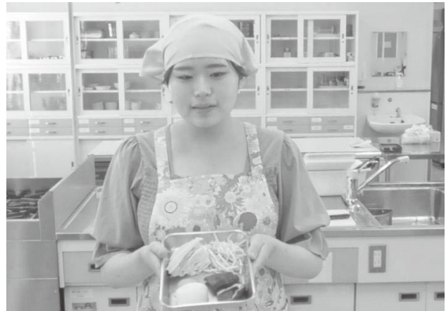
写真2「簡単に作れる料理の材料の説明」